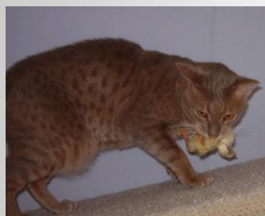
Amarant van Escoburg